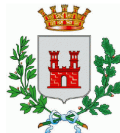
Città di Besana in Brianza