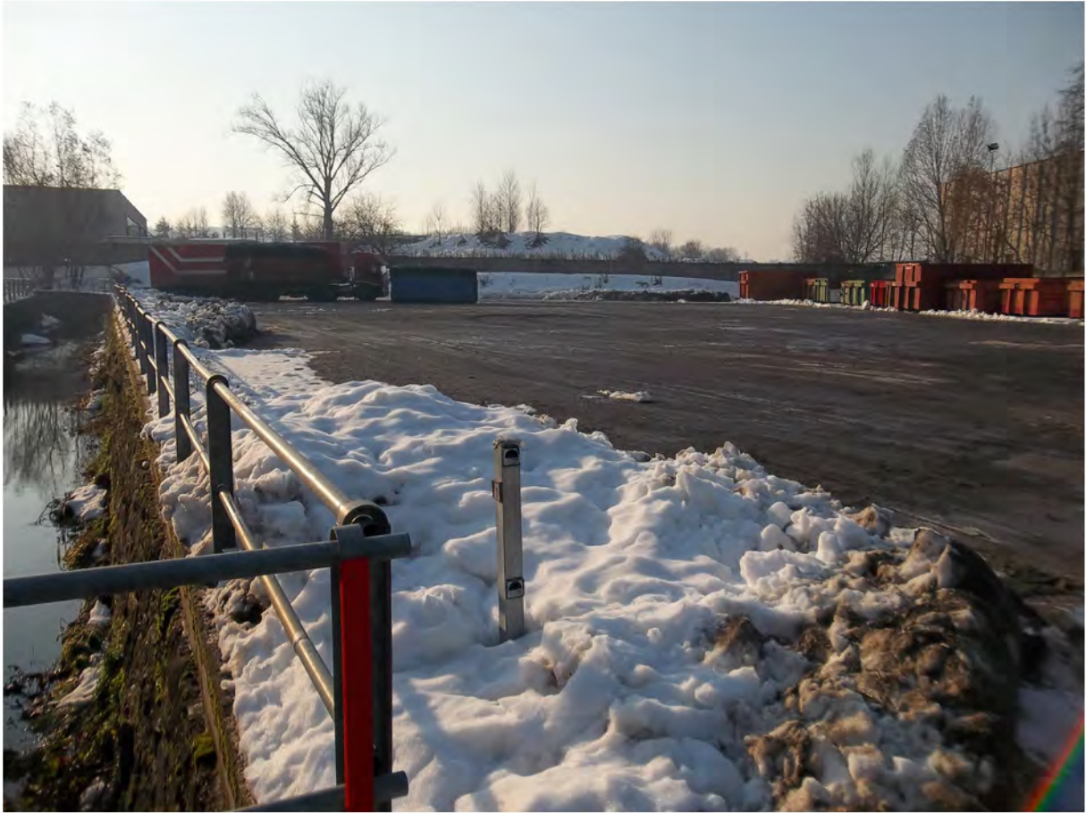
Immagine fotografica 1