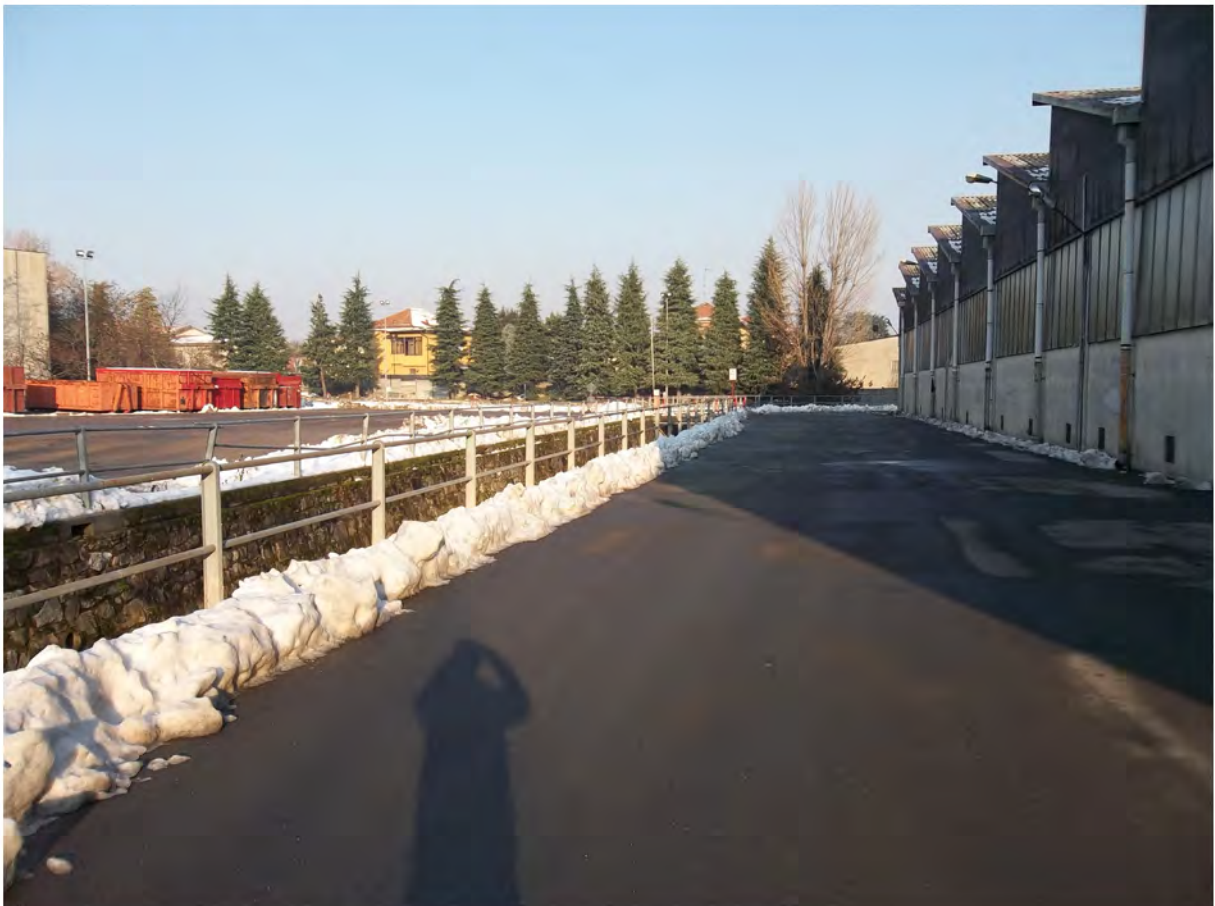
Immagine fotografica 2