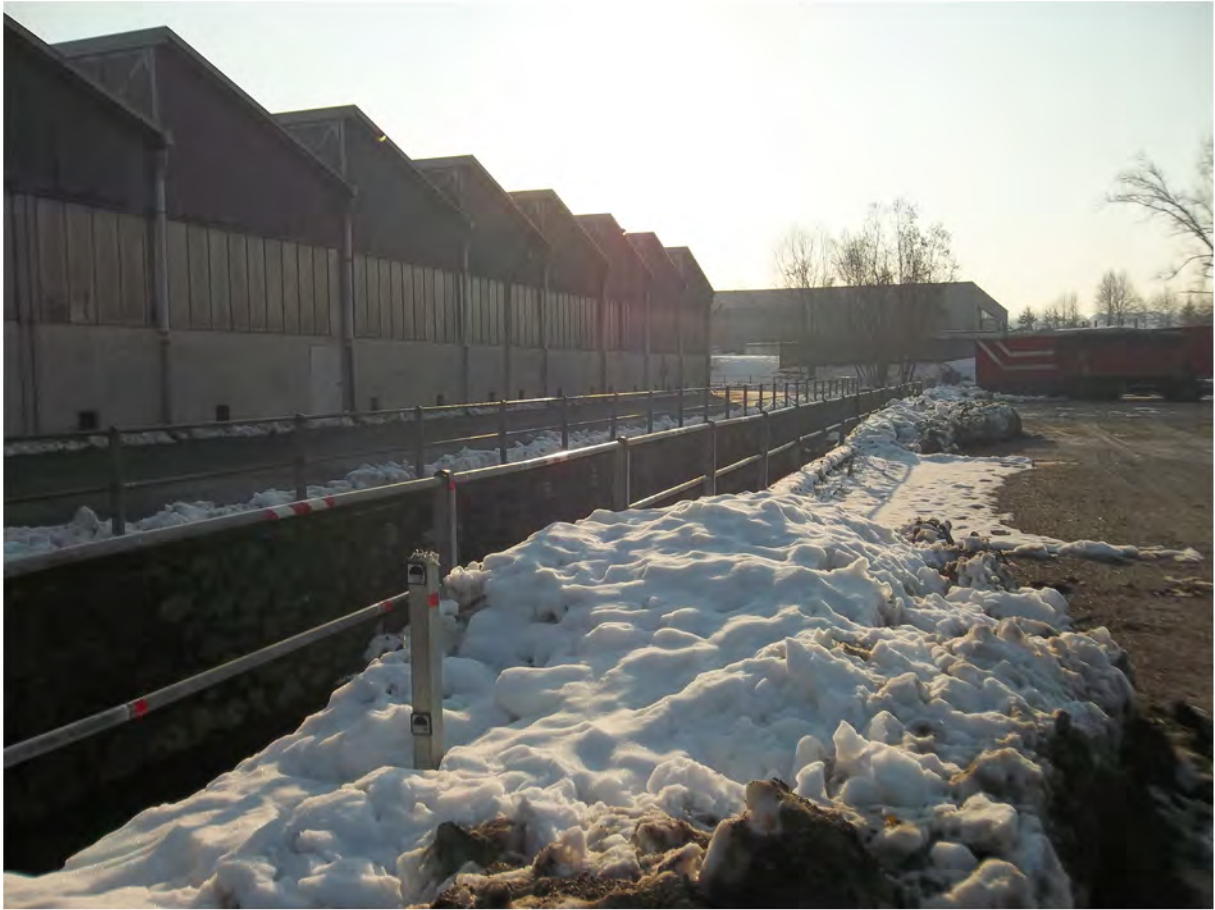
Immagine fotografica 3