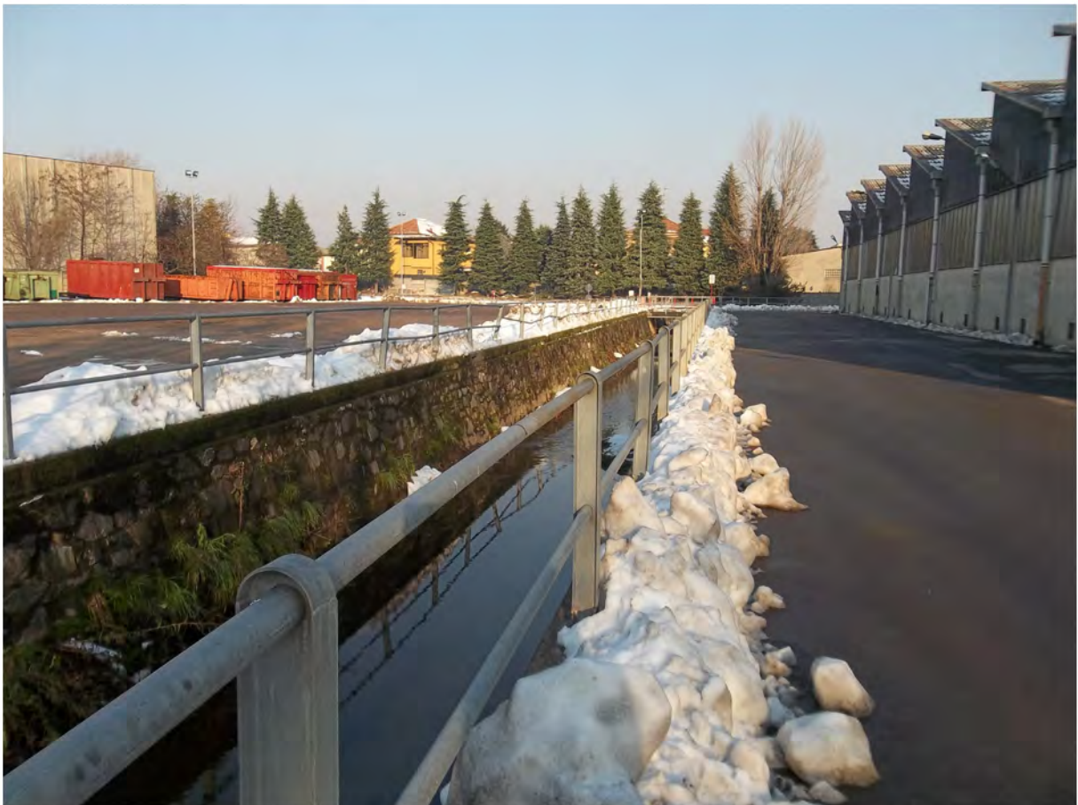
Immagine fotografica 4